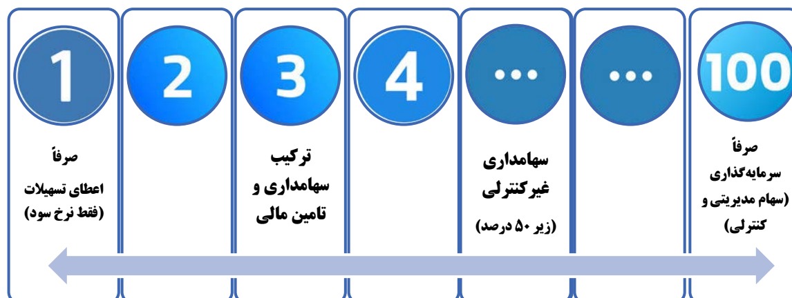
شکل ۲: انبوه گزینه‌های پیش روی صندوق توسعه ملی برای مشارکت در بنگاه‌سازی

همانگونه که شکل ۲ نشان می‌دهد گزینه‌های صندوق برای مشارکت در بنگاه‌سازی فقط تسهیلات صرف و یا فقط سرمایه‌گذاری صرف نبوده بلکه حد فاصل این دو نیز تعداد معتنا بهی مدل مشارکت برای بنگاه‌سازی قابل احصاء است.