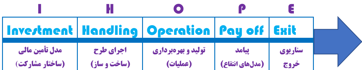
شکل ۴: مراحل یا بلوک‌های پنجگانه مدل (I-HOPE)

مدل سرمایه‌گذاری صندوق همانگونه که شکل ۴ نشان می‌دهد از پنج مرحله و یا اصطلاحاً بلوک مشخص اما به هم پیوسته تشکیل شده که از سمت چپ آغاز می‌شود.