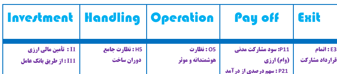
شکل ۶: کدبندی مدل I-HOPE برای نیروگاه‌های خودتأمین

عوااید صندوق پس از بهره‌برداری از دو محل یکی سود تأمین مالی و دیگری بهره‌مندی از درصدی از درآمد فروش ارزی برق ۳ انجام می‌پذیرد. مدل خروج صندوق با اتمام زمان مشارکت پایان می‌یابد و گزینه فروش زودتر از هنگام عوااید صندوق برای شریک نیز در صورت موافقت صندوق وجود خواهد داشت. در این مدل اجرا کننده طرح، انگیزه کافی برای ارتقاء عملکرد خود برای بهره‌برداری از طرح را خواهد داشت (زیرا که غالب عوااید طرح به خود وی بصورت مستقیم می‌رسد) و صندوق نیز اطمینان مناسبی از بازگشت ارزی منابع ارزی سرمایه‌گذاری خود خواهد داشت. ضمناً خریدار تضمینی برق (بعنوان مشتری و یا طرف سوم) نیز درآمد قابل توجهی به دلیل بهره‌مندی از برق پایدار کسب خواهد نمود. کدبندی این مدل در شکل ۶ آمده است.