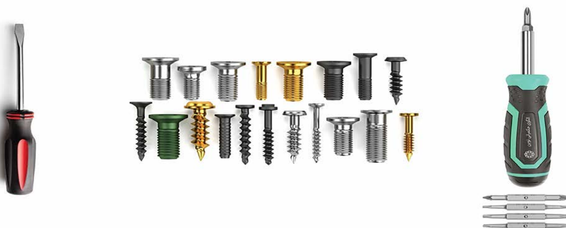
شکل ۳- از مدل تک مولفه‌ای (سمت چپ) تا مدل‌های چند مولفه‌ای (سمت راست)

در حقیقت مدل‌های سرمایه‌گذاری غیرمداخله‌ای، حاصل ترکیبی از انواع ابزارهای وام، سهامداری غیر کنترلی، انواع صندوق‌های سرمایه‌گذاری (پروژه‌ای، خصوصی و ...)، انواع اوراق (ارزی و ربالی، مبتنی بر سهام، بدهی، دارایی و مشتقه) و ابزارهای مبتنی بر اختیار خرید/ فروش می‌باشد.