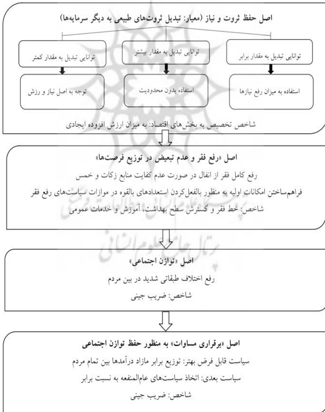
شکل ۳: اصول توزیع عادلانه منابع طبیعی تجدیدناپذیر در اقتصاد اسلامی