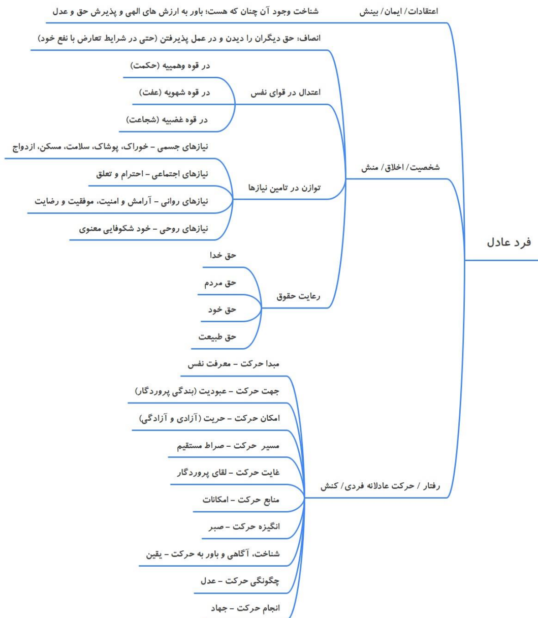
شکل ۱: فرد عادل: ساحت های ایمان، اخلاق، حرکت عادلانه فردی

عدالت در بعد جمعی نیز سه ساحت زیر را در بر می گیرد: